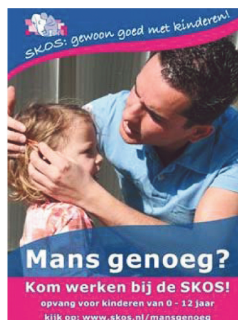
Source : Assez viril ? Venez travailler avec nous ! , affiche néerlandaise de promotion ciblée des métiers de l'enfance.

autour de la naissance. Mais, dans un contexte où les métiers de la petite enfance restent quasi exclusivement féminins, les personnels des structures d'accueil et les assistantes maternelles tendent à reproduire des attitudes différenciées vis-à-vis des pères (estimés moins intéressés et compétents) et des mères (souvent les seules sollicitées) (15) . Ces professionnels pourraient être sensibilisés aux bonnes pratiques d'implication des pères (invitation du père et de la mère à l'inscription et aux temps d'échanges, appel des deux parents en cas d'enfant malade, etc.) (16) . En France, il avait été proposé de fixer un objectif de mixité dans les formations aux métiers de la petite enfance (10 % d'élèves masculins à un horizon de cinq ans) (17) . Plusieurs pays européens (Danemark, Norvège, Pays-Bas, Belgique, Royaume-Uni) ont expérimenté cette démarche dans les années 2000, en associant une promotion ciblée des métiers et du tutorat (18) .